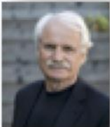
Yann Arthus-Bertrand Photographe, fondateur de GoodPlanet.