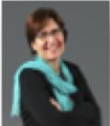
Valerie Masson-Delmotte Paléo-climatologue, co-présidente du Groupe n°1 du GIEC.